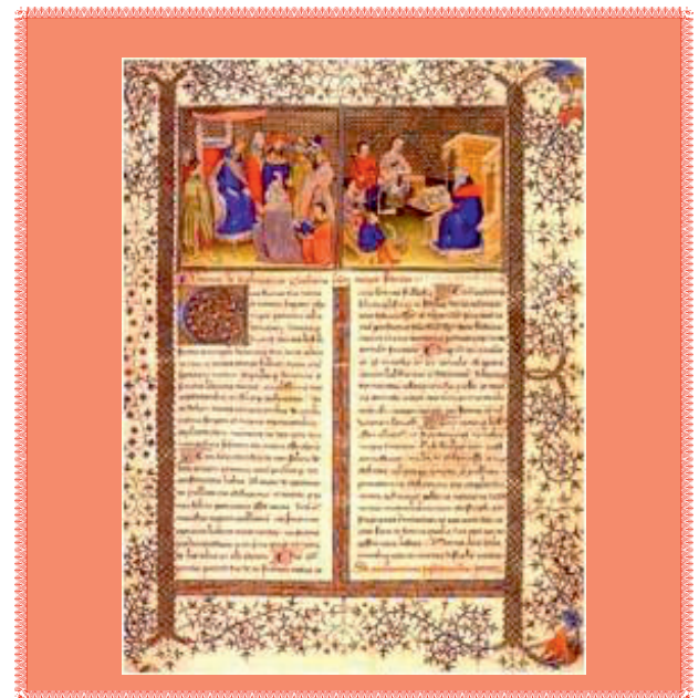
Fig. 3 - VITRUVIO, De Architectura , frontespizio miniato, XV sec., Plut. 30.10 - Biblioteca Laurenziana, Firenze. - VITRUVIUS, De Architectura , illuminated title page, XVth c., Plut. 30.10 Laurenziana Library, Florence.

[...] putavi, quoniam in prioribus septem voluminibus rationes aedificiorum sunt expositae, in hoc oportere de inventionibus aquae, quasque habeat in locorum proprietatibus virtutes, quibusque rationibus ducatur, et quemadmodum ante probetur, scribere.