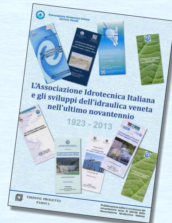
Frontespizio del volume pubblicato in occasione del novantesimo anno dalla istituzione dell'Associazione Idrotecnica Italiana