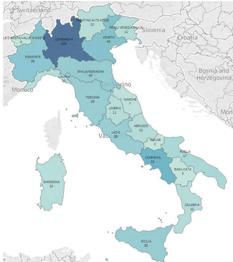
Figura 16.2 - Distribuzione regionale degli stabilimenti di soglia inferiore soggetti al D.Lgs.105/15 (30/06/2019)