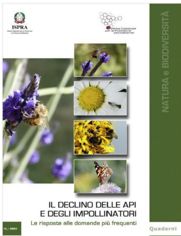
Foto 2. Il declino delle api e degli impollinatori – Le risposte alle domande più frequenti. ISPRA, Quaderno 12/2020

Un ulteriore fenomeno di criticità ambientale è la sopravvivenza delle popolazioni di esemplari di zanzare a un determinato insetticida. L'aumento della resistenza è un processo trasmesso in via ereditaria per selezione e causato dalla elevata frequenza dei trattamenti. L'azione tossica residuale, i trattamenti su ampie aree e un elevato tasso riproduttivo delle zanzare 32 favoriscono l'insorgenza.