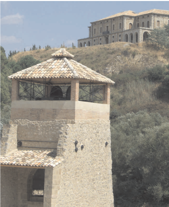
Miniera Floristella: Pozzo n. 1

La Mostra “ Percorsi del Patrimonio Industriale in Italia ” organizzata a Termini Imerese in occasione del decennale dell'AIPAI nel 2006 e realizzata con la collaborazione di tutte le Sezioni regionali dell'AIPAI, a cura di Roberto Parisi e Manuel Ramello, in circa 80 pannelli offre una panoramica delle svariate tipologie di patrimonio industriale esistenti nelle diverse regioni italiane, distinte in quattro ambiti tematici: testimonianze di rilevante interesse storico a rischio; emblematici esempi di comprensori geo-morfologicamente segnati dallo sviluppo