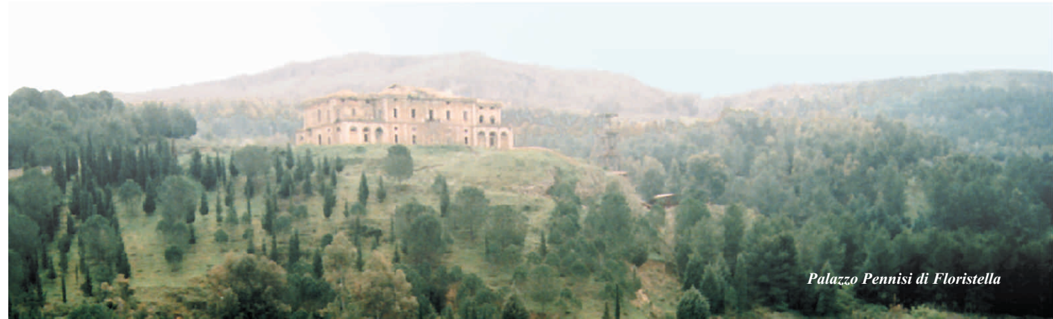
Palazzo Pennisi di Floristella

del sistema di fabbrica; casi di eccellenza nel recupero urbano e/o architettonico e significative esperienze di musealizzazione. Varie sono state le iniziative che hanno trasformato questo lavoro in una mostra itinerante accolta con interesse in Liguria, Toscana, Marche, Puglia e Piemonte.