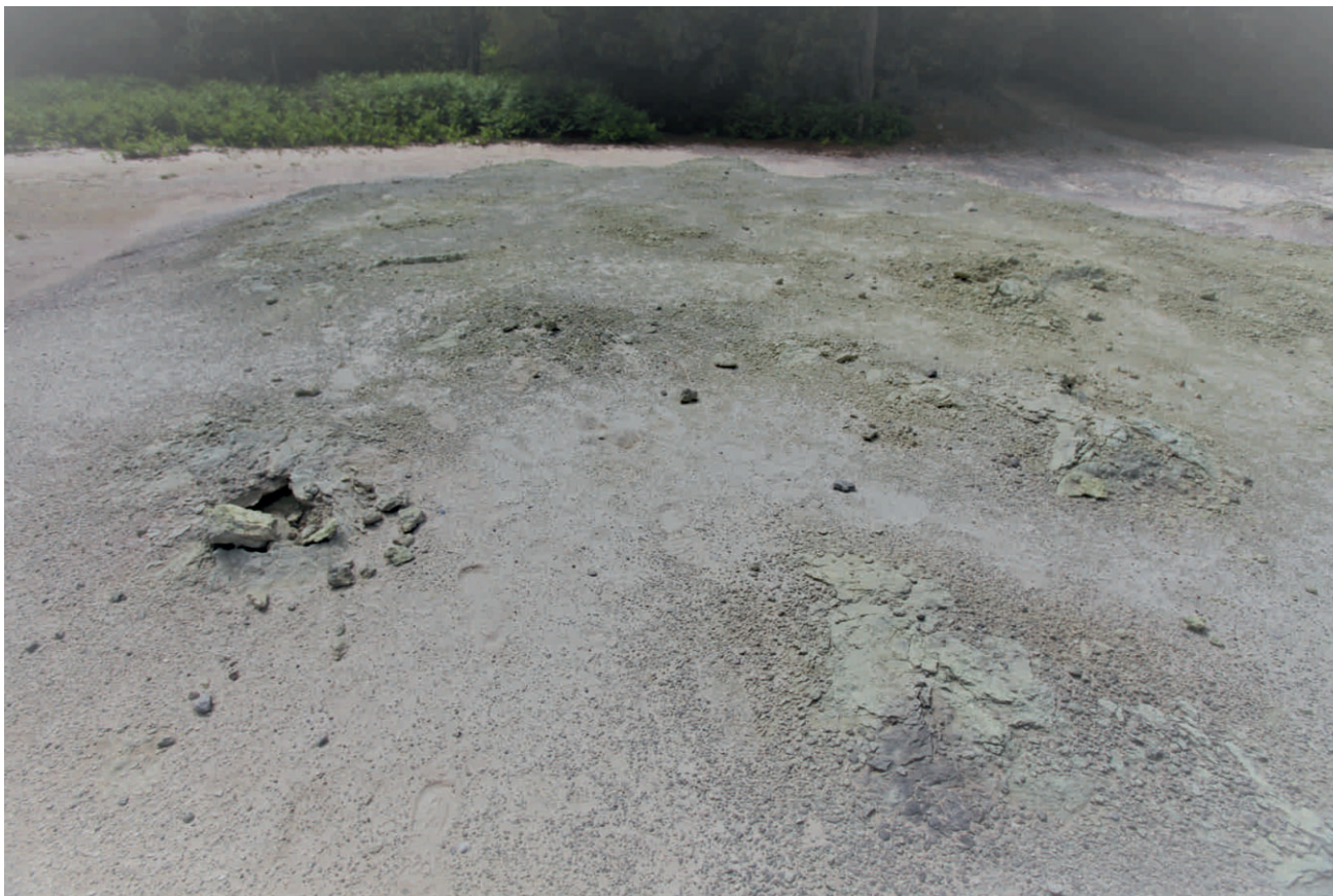
Fig. 2 - Rigonfiamento del terreno causato dalla risalita di gas endogeni nella Riserva Naturale Regionale Tor Caldara. - Ground swelling caused by the rise of endogenous gases in Tor Caldara Regional Natural Reserve.

siderarsi sistemi capaci di riattivazione con generazione di terremoti che possono risentirsi anche nell'area romana (GASPARINI et alii , 1991; PANTOSTI & VELONÀ, 1991).