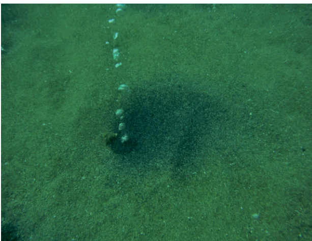
Fig. 5 - Depositi mineralizzati di forma sub-circolare. - Sub-circular shaped mineral deposits.

I punti di emissione gassosa presentano caratteristiche differenti a seconda della natura del substrato geologico. Le emissioni su fondo sabbioso sono infatti caratterizzate dalla presenza di ossidi metallici precipitati, che formano un deposito di forma subcircolare centrato sul punto di emissione e di colore nettamente più scuro rispetto alle sabbie circostanti (figg. 5, 6). Tali punti di emissione appaiono grossomodo allineati lungo un tratto di circa 10 m di lunghezza, a testimonianza della loro probabile origine in corrispondenza di un lineamento tettonico.