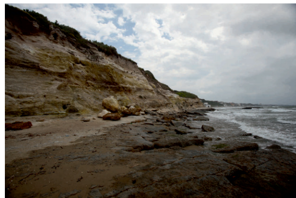
Fig. 3 - Falesia antistante le emissioni sottomarine. - Cliff facing submarine gas vents.

Sono state individuate due distinte zone di emissione gassosa: la prima su substrato sabbioso, indicata in figura 1 come punto 1 e avente coordinate Lat.: 45°57'20.57" N - Long.: 231°88'68.17" E; la seconda su substrato roccioso, indicata in figura 1 come punto 2 e avente coordinate: Lat. 45°57'68.9" N - Long. 231°88'41.92" E.