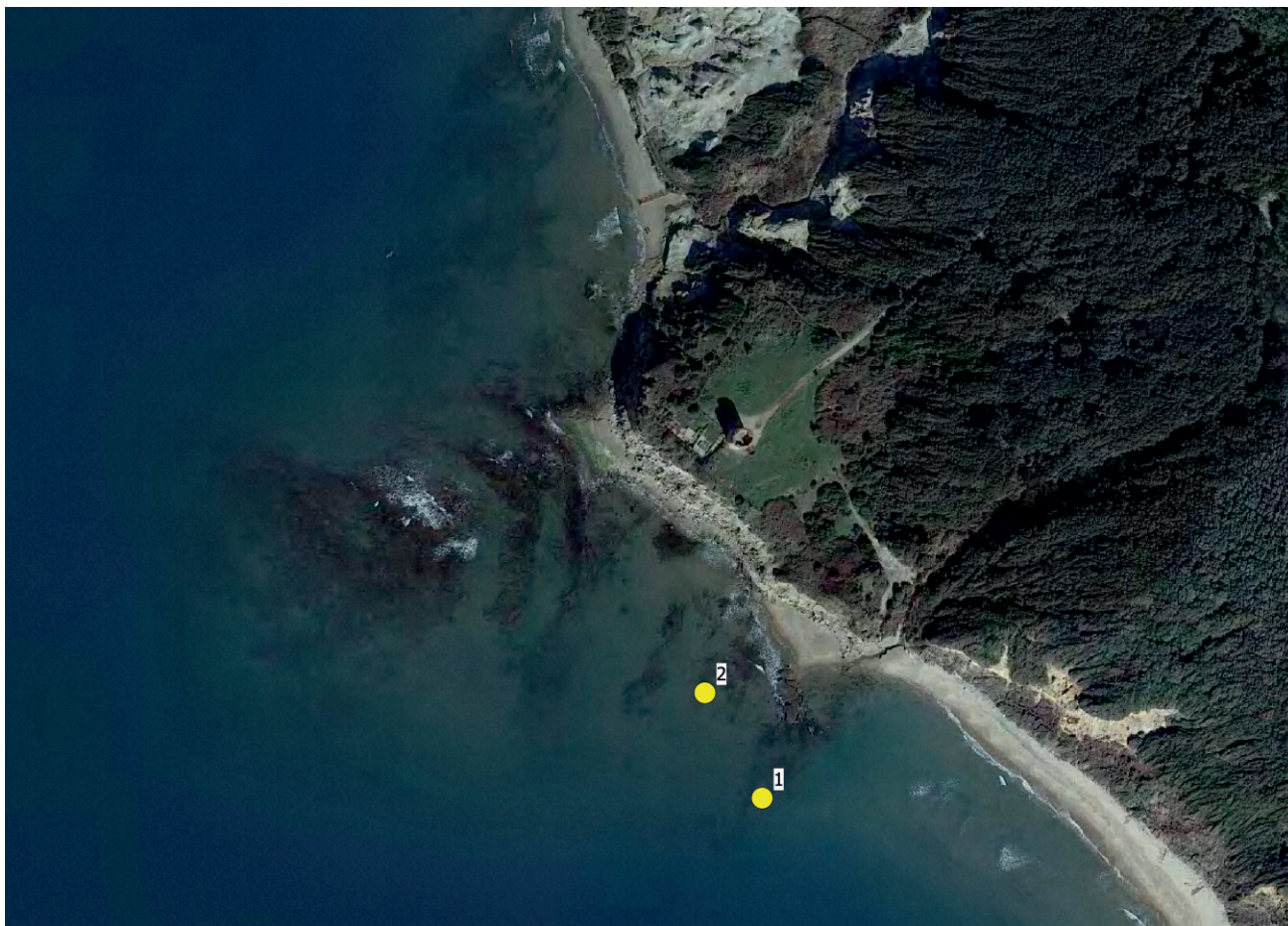
Fig. 1 - Ubicazione delle emissioni gassose sottomarine. - Location of the submarine gas vents.

stoceniche, livelli permeati dalla risalita di gas ricchi, tra gli altri, in zolfo (fig. 2).