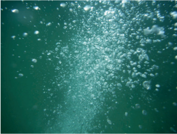
Fig. 4 - Emissione gassosa sottomarina in risalita. - Rising submarine gas vent.

Non sono state effettuate analisi della composizione dei gas sottomarini emessi ma, vista la loro evidente appartenenza all'ampio areale compreso tra Lavinio e Anzio (ANTONELLI et alii , 2010), con ottimo livello di confidenza è possibile ipotizzare che essi presentino CO 2 come gas principale ed un contenuto minore di altre sostanze come H 2 S, N 2 , CH 4 e 222 Rn, come evidenziato da molti autori (CHIODINI & FRONDINI, 2001; ANNUNZIATELLIS et alii , 2003; CARAPEZZA et alii , 2003; TUCCIMEI et alii , 2006).