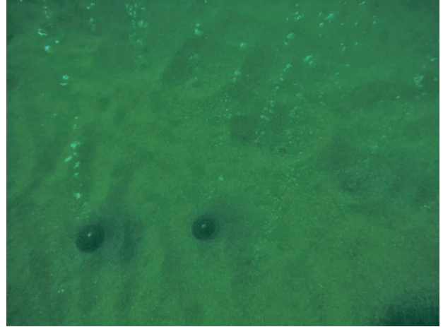
Fig. 6 - Emissioni gassose su fondo sabbioso. Profondità: circa 3 metri. - Gas vents on the sandy bottom. Depth: approximately 3 meters.

Le emissioni su fondo roccioso sono caratterizzate dalla presenza di colonie bentoniche filamentose di solfobatteri (fig. 7). PATWARDHAN & VETRIANI (2016), hanno identificato questi organismi come batteri mesotermi, anaerobi facoltativi e chemiolitoautotrofi facoltativi e, dopo aver effettuato un'analisi genetica, hanno istituito un nuovo genere ed una nuova specie: Varunaivibrio sulfuroxidans .